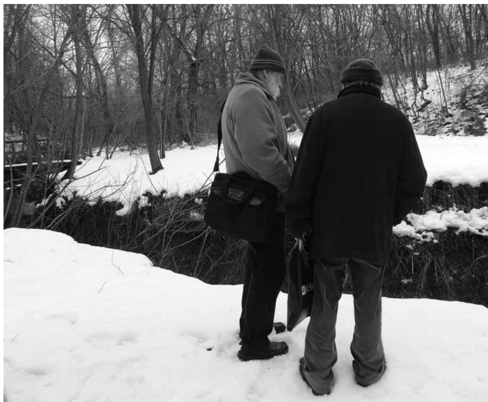
A geológusok a megmélyült patak-medert is megszemlélték

ismerősökkel méricskélünk – de sajnos mindig reménytelennek ítélték a forrás megindítását.