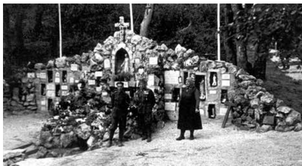
A Rab Mária-forrás 1943-ban

Példás rend és fegyelem, valamint bensőséges buzgóság jellemezte a szép könyörgő körmenetet.”