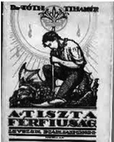
A Tiszta férfiúság c. könyv eredeti fedlappja

– Igen, anyukám, és azt is tudom, miért szeretem én is anyukámat jobban, mint bárkit ezen a kerek világon – szolt a fiú s hálás könnyekkel szemében átkarolta édesanyját.