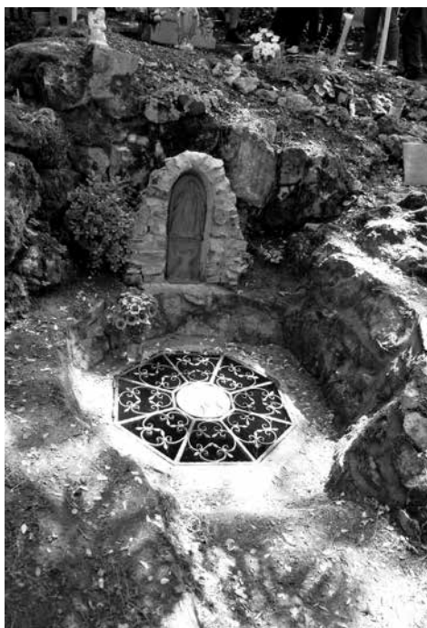
Az elkészült kút-fedél a Mária-szoborral 2014. júliusában

utánzó nyolcszögletű szecessziós mintázatú kovácsoltvas tetőt rajzoltam, közepén a Madonnával.