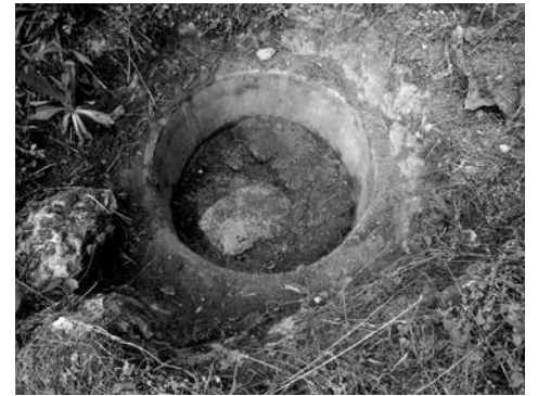
Megcsillan a víz a kútban 2009-ben

zetésével – legelőször levonult a völgybe, és az első szervezett közös munkán a betemetett kútból kimertük a földet egy méter mélységig. Még reménykedtünk, hogy a kút mélyén találunk vizet. Valami kis nedvességet tényleg elértünk, de később