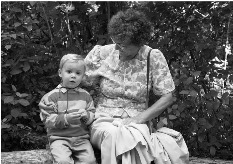
Domonkossal a forrásnál

Isten és Szűzanyánk akarata csak rajtunk keresztül valósulhat meg!