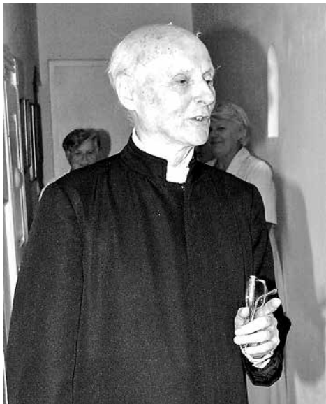
Gaál Jenő atya 2014-ben

De szónok volt-e? A tartalmat és külső formát, mely szónokainkat jellemezni szokta, Tóth Tihamérnél hiába keressük. Nem olyan szónok volt, mint a többi, és nevét mégis beírta a magyar egyházi szónoklat történetébe. Mikor hivatalból az Egyetemi templom szószékére lépett, nem volt szónoki sikerekben gazdag múltja. Az évek folyamán az újszerű prédikálás stílusát ő maga teremtette meg. Nem volt szónok abban az értelemben, hogy rendelkezett vol-