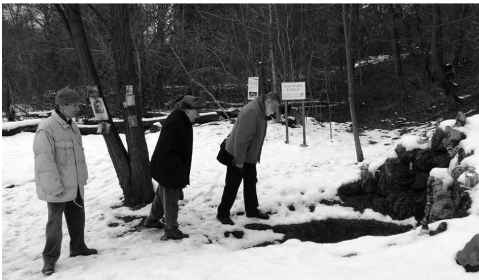
A szakemberek a kút mélyére is betekintettek

Volt már több próbálkozásunk szakemberekkel. A Bakonykarszt szakértőivel helyszínelünk, kútúró és vízügyes