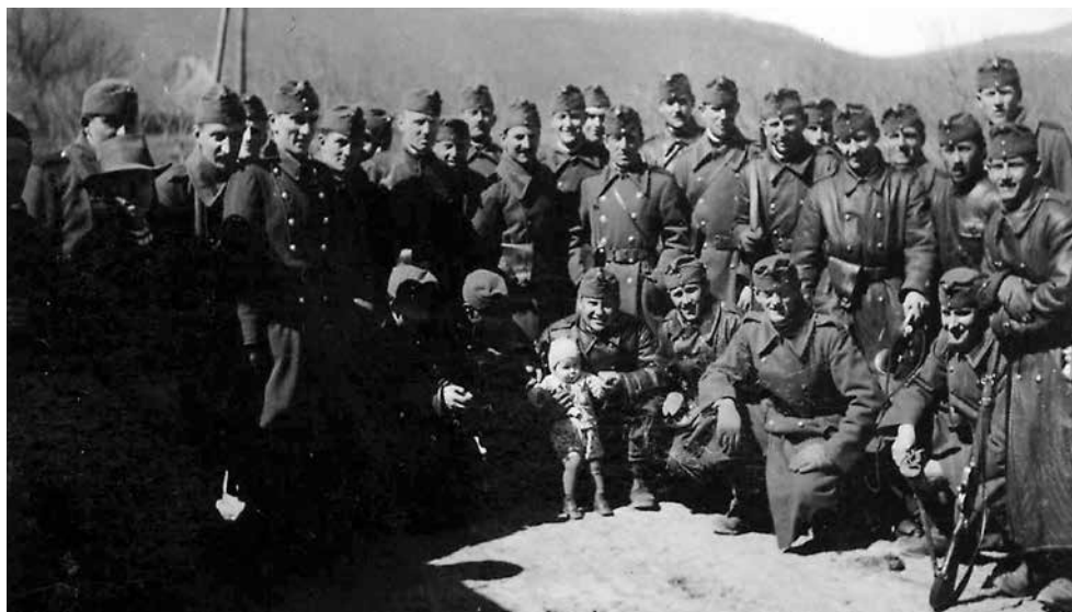
Jutasi katonák valamikor a 40-es években

Nekem csak jó tapasztalataim vannak a Jutason kiképzettekkel kapcsolatban.