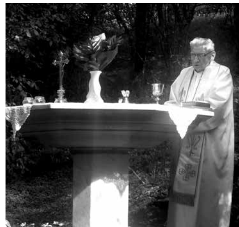
Ebele atya misét tart a forrásnál

Napjainkban Fogolykiváltó Boldogasszony tiszteletének tartalma kibővült a